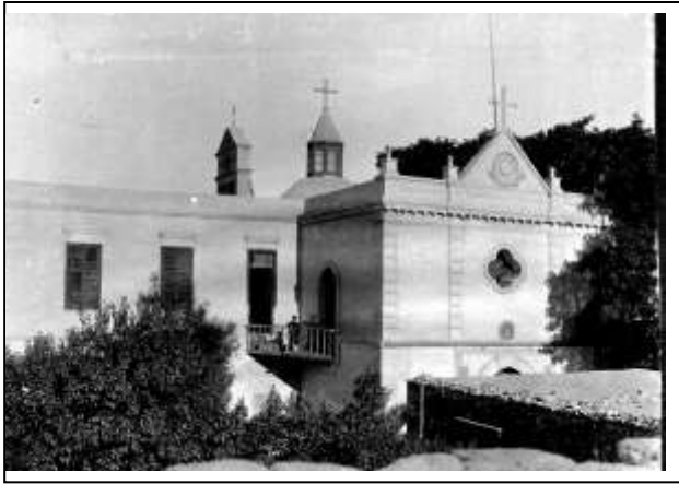
كنيسة العائلة المقدسة والدير ببني سويف قبل التجديد

وفي عام 1899 عين الأب ديمتريو بوراكي ليعاونه في الرسالة فأهتم بالرعية وبالمدرسة التي كانت تدرس بها اللغات الإيطالية والعربية والفرنسية والدين. ثم افتتحت الحكومة الإيطالية مدرسة أخرى عرفت بالمدرسة الإيطالية إلا أنها أغلقت في الخمسينيات. وبعد وفاة الأب فورتوناتو في عام 1912